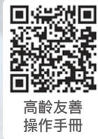
高齡友善 操作手冊