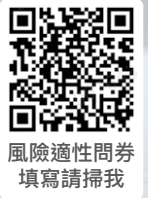
風險適性問券 填寫請掃我