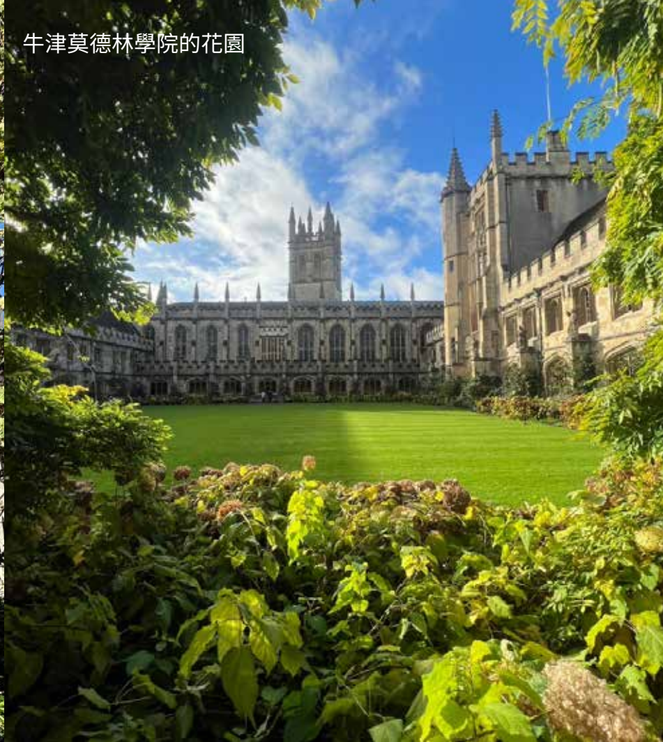
牛津莫德林學院的花園