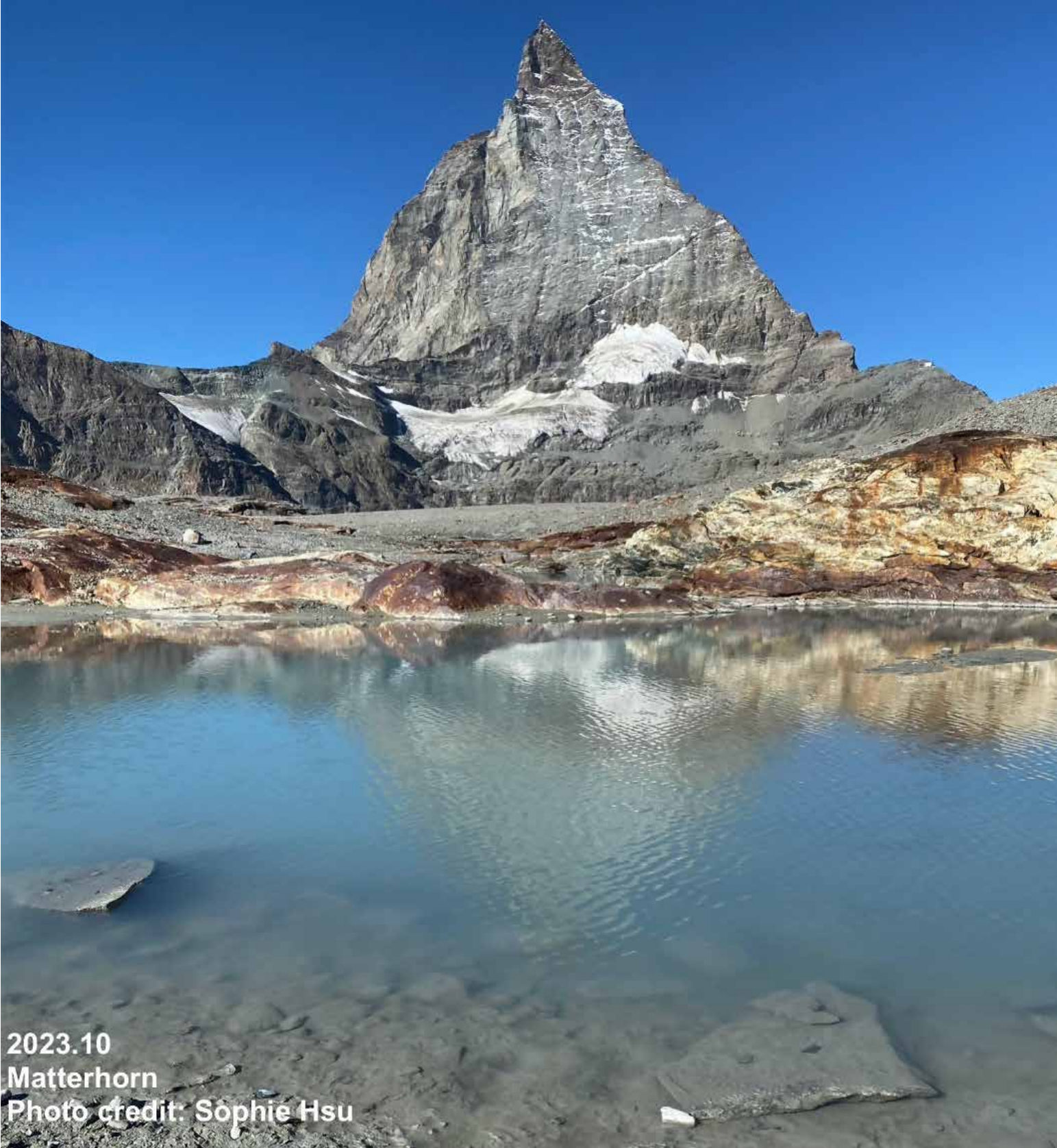
2023.10 Matterhorn