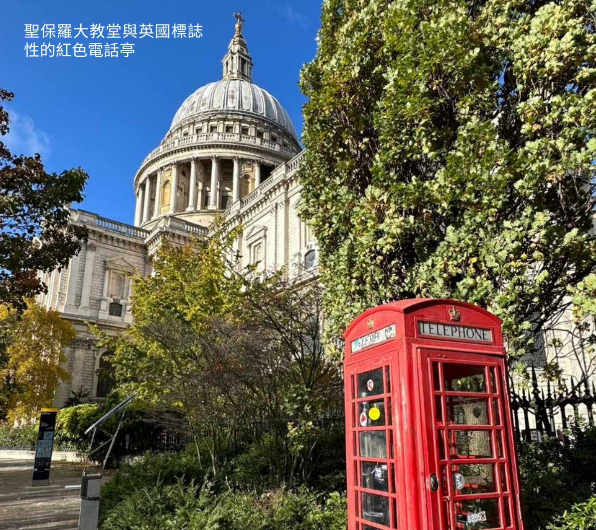
聖保羅大教堂與英國標誌性的紅色電話亭