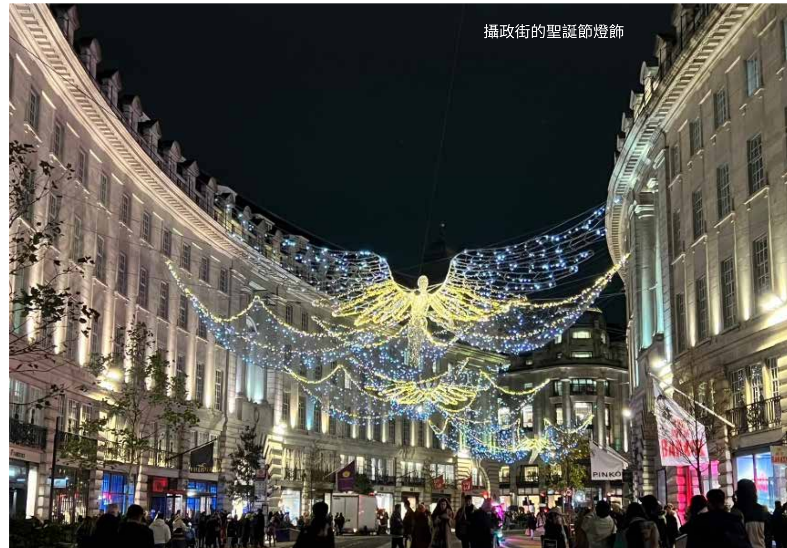
攝政街的聖誕節燈飾

這次的英國自由行，是我第一次踏上歐洲土地，體驗了不同於亞洲的文化風情，這趟旅程有大自然的美景相伴，也有火車誤點記，還有半夜虛驚一場的旅館火災警報！與我對於孩子們精心策畫的行程，感受到孩子們用心安排，彼此都有滿滿的收穫與難以忘懷的美好回憶。